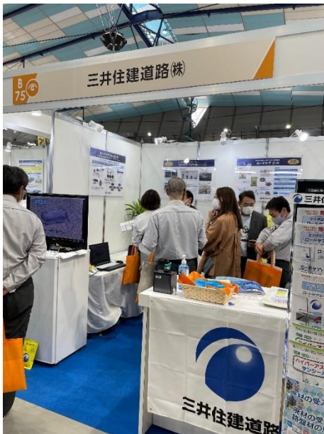
【 当社出展ブースの様子 】