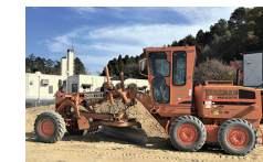
▲モーターグレーダ