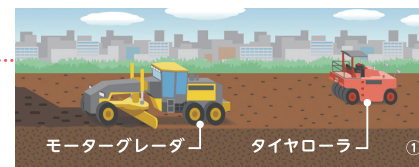
モーターグレーダ タイヤローラ ①

ブルドーザーやモーターグレーダという機械で、土を削って平らにします。その後、タイヤローラなどで土を締め固めて、路床(①)を作ります。