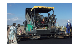
▲アスファルトフィニッシャー