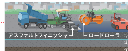
アスファルトフィニッシャー ロードローラ ⑤ ④ ③ ②

ダンプトラックでアスファルト合材を運び、アスファルトフィニッシャーという機械で平らにしてロードローラで締め固めます。基層(④)→表層(⑤)の順で行います。