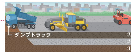
ダンプトラック ③ ② ①

ダンプトラックで砕いた石を運び入れ、モーターグレーダで平らにしてタイヤローラで締め固めます。下層路盤(②)→上層路盤(③)の順で行います。